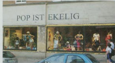
Der beste Shop-Name der Stadt (Kantstr.)