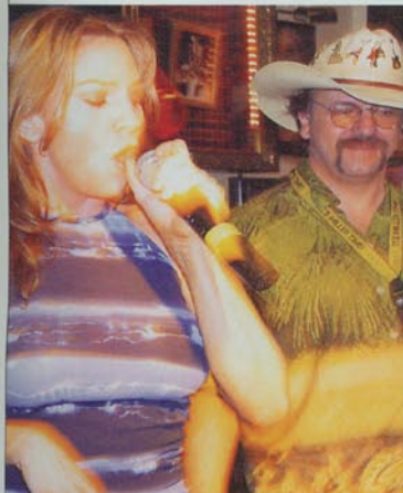
Doctor Dot versucht's nun mit Singen

Lippen. +++ Bürgermeister Wowereit (Foto) empfing im Roten Rathaus die Szene-Guides von BTII. Als Dankeschön gab's für ihn einen „I Love Wow!“-Button, den er seinem Freund schenken will. +++ Nein, das ist keine Promi-Look-Alike-Contest mit Mareille Mathieu und Toni Polster (Foto), sondern Fotografin Tina . w-k (re.) mit neuen Bildern und alten Freunden bei Circle Culture . +++ Harald Schmidt (Foto) hasst zwar Berlin, verkündete aber dennoch an der Spree, dass er nun auch montags auf der Mattscheibe seine Witze reißen wird. Danke. +++ Die Levi's -Modenschau endete in einem feudalen Saufgelage. Wodka-Red Bull satt und prompt, ließ den Alkoholpegel der Gäste auf durchschnittlich 1,2 Promille ansteigen. Prost. +++ Bei New Faces trafen sich vor allem Serien-Sternchen und dickbäuchige Manager („Baby, ich bring dich ganz groß raus“), die ihre Wampe stolz wie ein Statussymbol vor sich her trugen, während ihre Augen den Damen ins Dekolleté kullerten. Glamour und echte Promis wie Bernd Eichinger und Sandra Maischberger hingegen bei der zeitgleich stattfindenden Absolut Nacht im 90 Grad . +++ Das Grabowski feierte Geburtstag. Das Ständchen