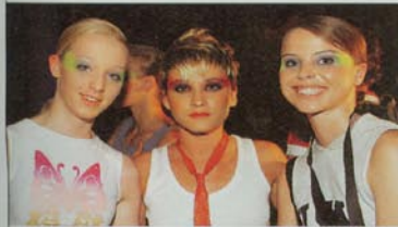
Designer Walk Off mit Sängerin Monica (Mitte)